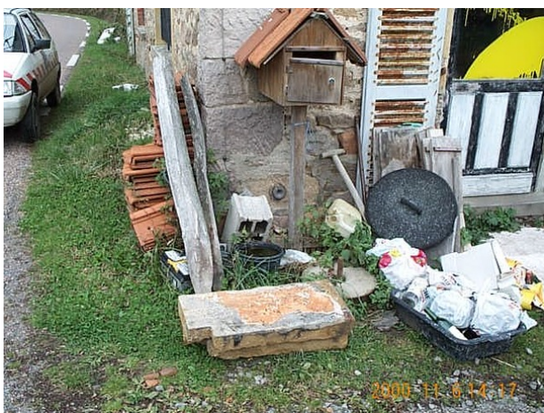
Le repère est au centre de la photo

Remarques : Exploitable par GPS depuis une station excentrée